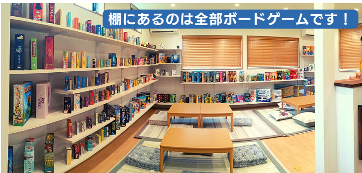
棚にあるのは全部ボードゲームです！

どちらもオーナー様や そのご家族のこだわりや 好きなものが詰まった、 とても魅力的なお店とな っております！